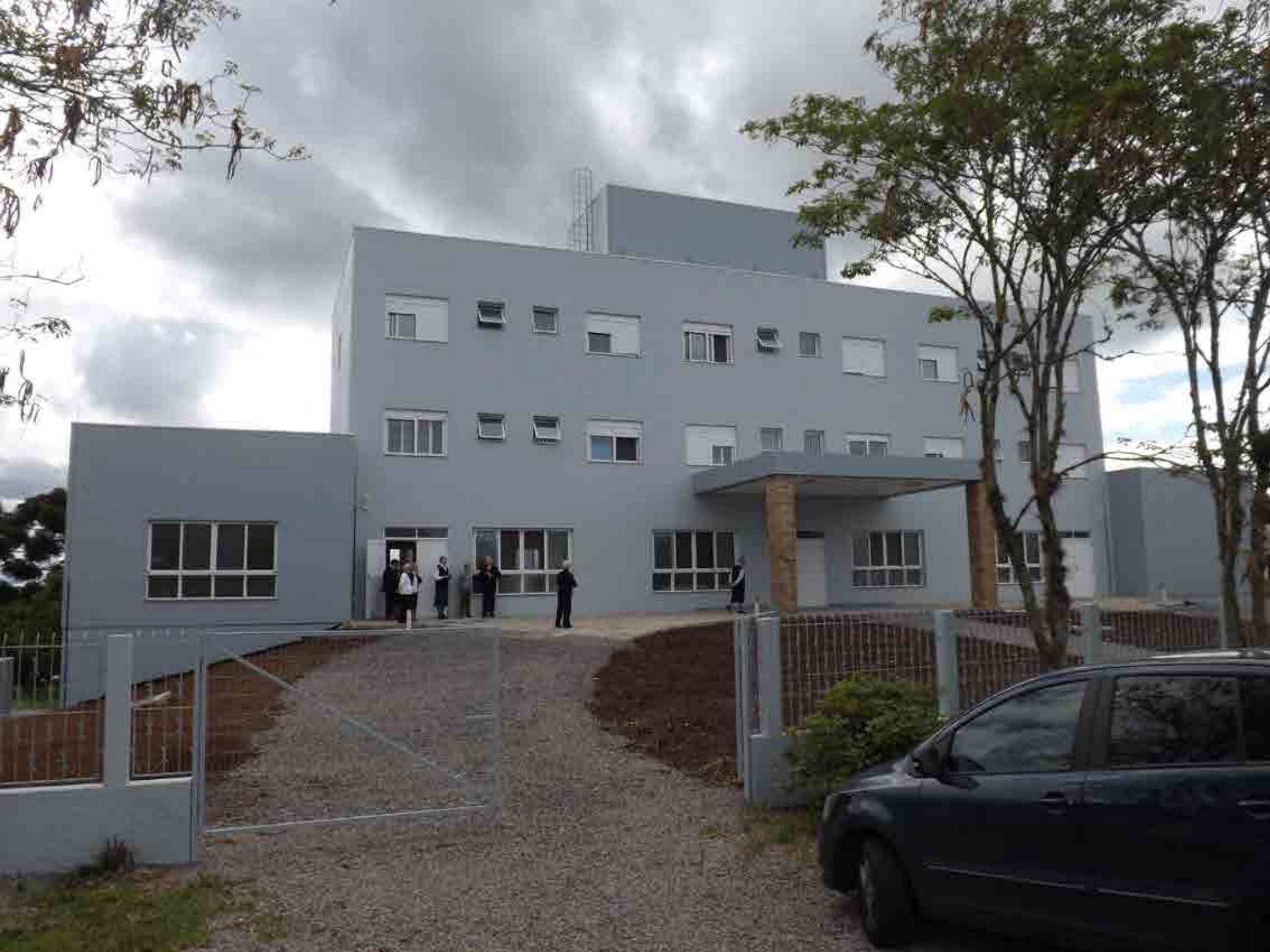
Inauguração e bênção da Casa Jesus Bom Pastor