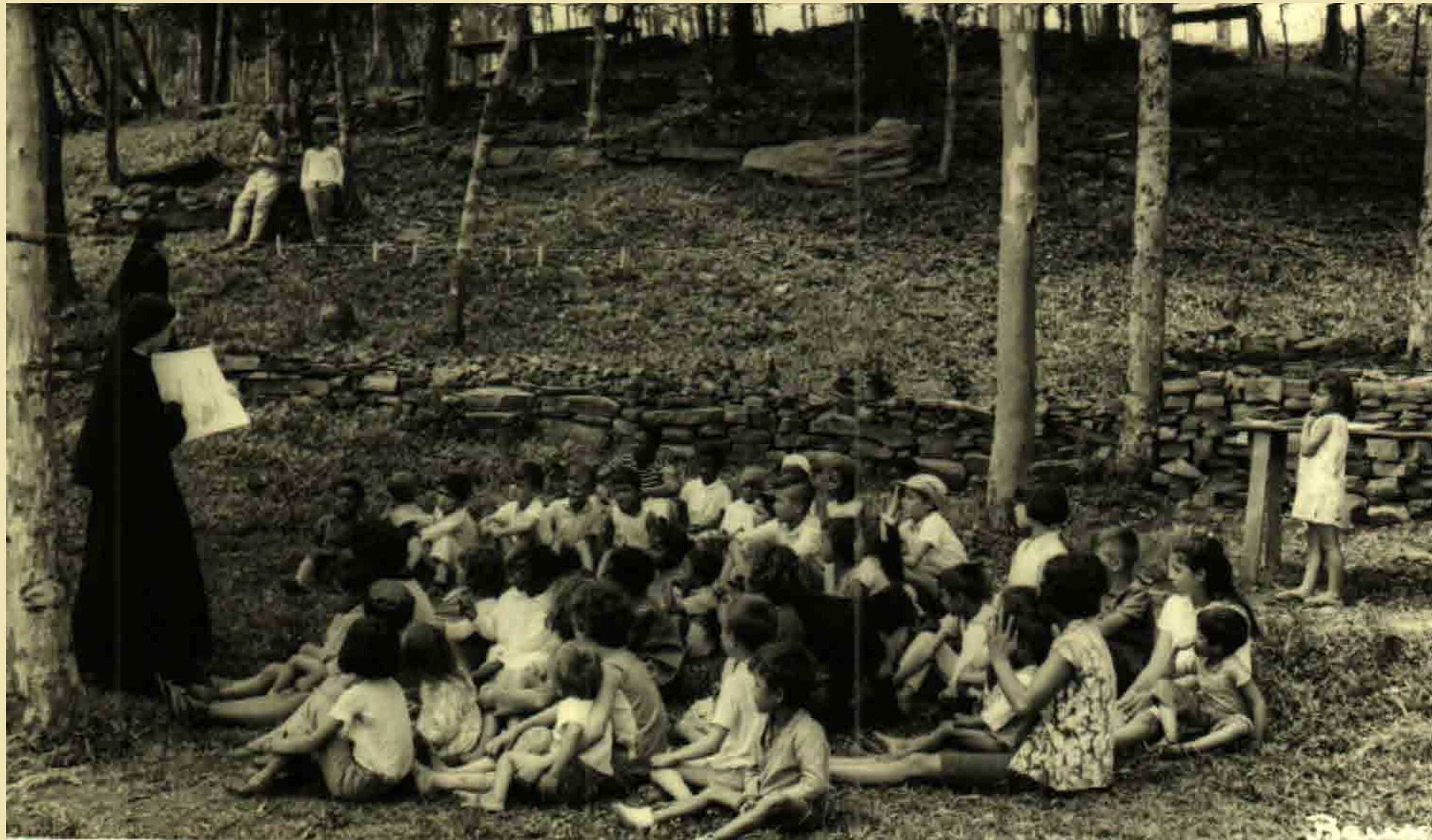
Primeiros tempos catequese para crianças em Caxias do Sul-RS