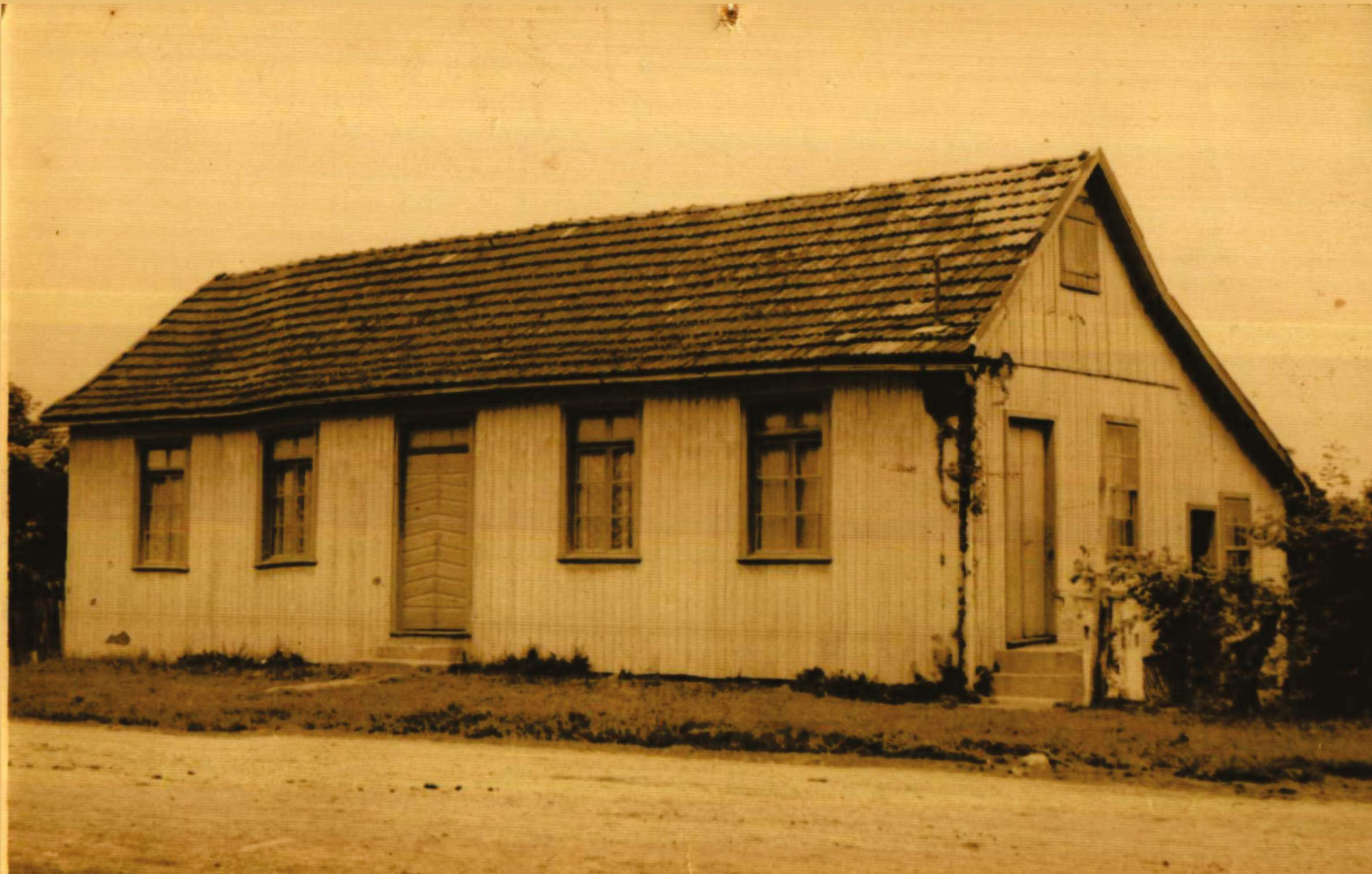
1ª Casa das Pastorinhas no RS